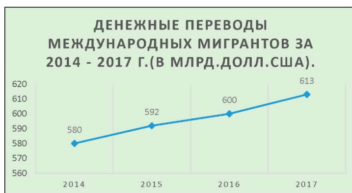
Рис. 1.

Рассмотрим график денежных переводов международных мигрантов за 2014-2017 год. По оценкам Всемирного банка, в 1970 г. объем полученных переводов в денежной форме составлял всего 1,9 млрд.долл., в 1980 - 36 млрд долл., в 1990 г. - 64 млрд, в 2000 г. - 127 млрд, в 2014 г. - 580 млрд. долл., в 2016 - 600 млрд.долл., а в 2017 году денежные переводы от трудящихся-мигрантов выросли до 613 млрд.долл.