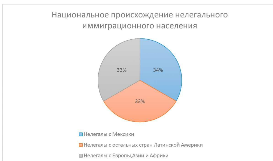
Рис. 2.